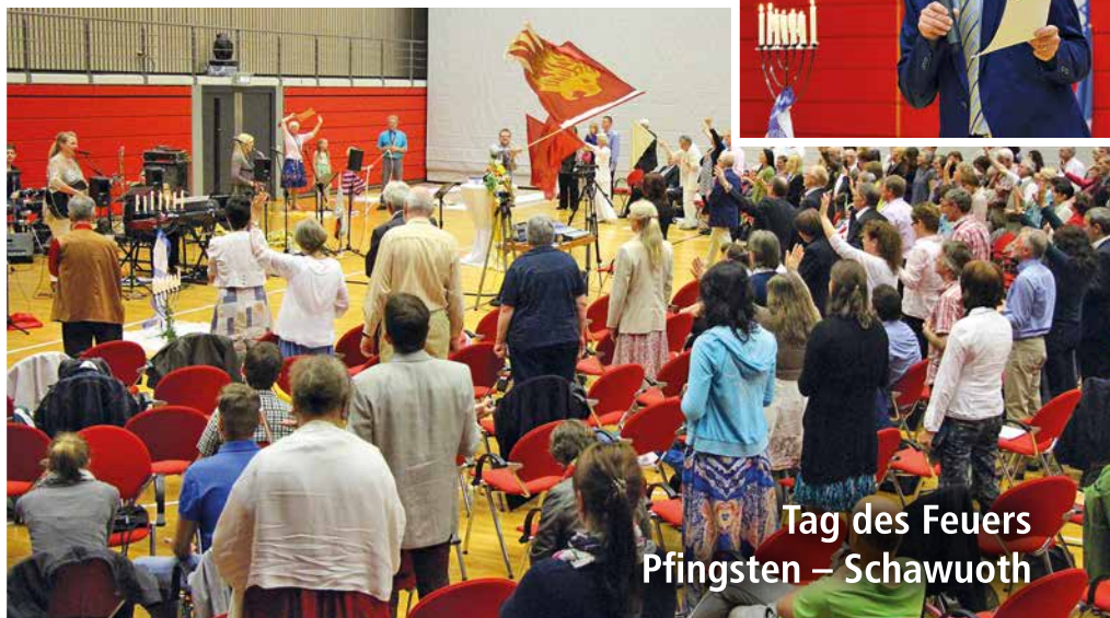
Tag des Feuers Pfingsten – Schawuoth